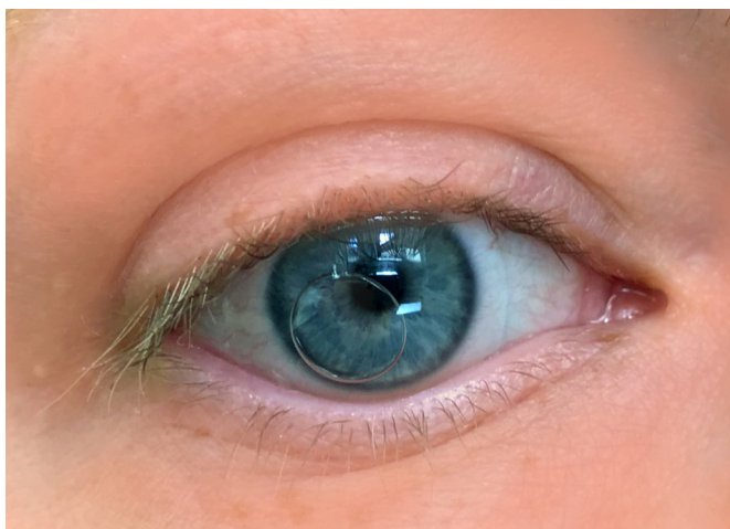
Luftblase unter der Sklerallinse